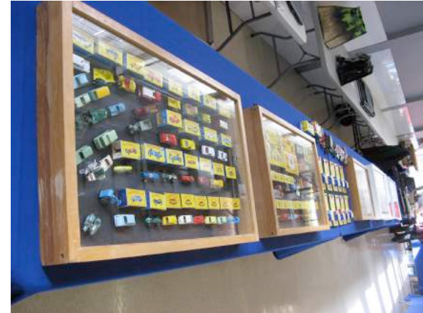
Des autos miniatures nous ont été exposé par André Chenette